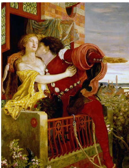
“Romeo y Julieta” Ford Madox Brown

Si cineastas, músicos y escritores nos han dejado sus particulares visiones de Romeo y Julieta, los pintores no podían ser menos. Muchos artistas no han querido dejar pasar la oportunidad de representar en sus cuadros esta historia de amor prohibido y han pintado los escarceos, despedidas y besos furtivos de los amantes de Verona. Aquí pueden ver las obras de dos prerrafaelitas, pintores británicos de mediados del S. XIX.