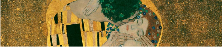
Fragmento de “El beso” de Gustav Klimt

https://www.pressreader.com/spain/muy-interesante/20170523/282711931969907