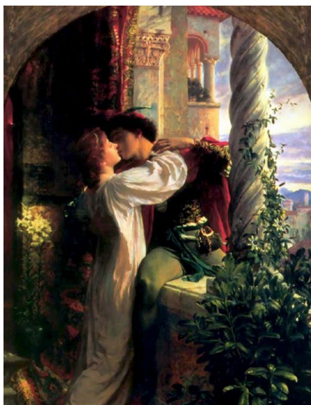
“Romeo y Julieta” Sir Frank Dicksee

Anímense a hacer su propia obra “romántica”.