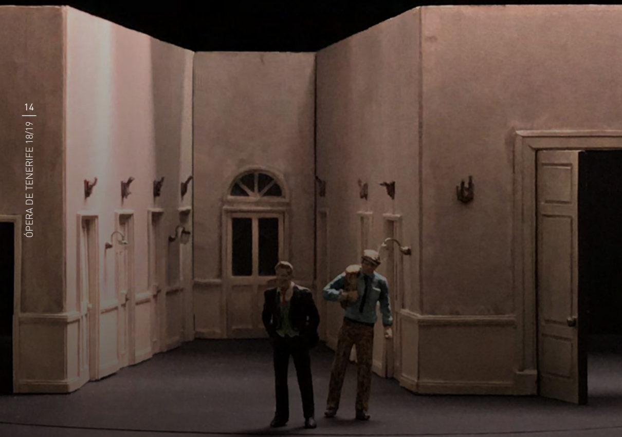
Maqueta escenografía Lucia di Lammermoor

“El episodio de la enajenación de Lucia y sus avatares sentimentales con Edgardo se enmarcan en un contexto de gran inestabilidad y tensión sociopolítica que constituyen el armazón de la historia (...)”