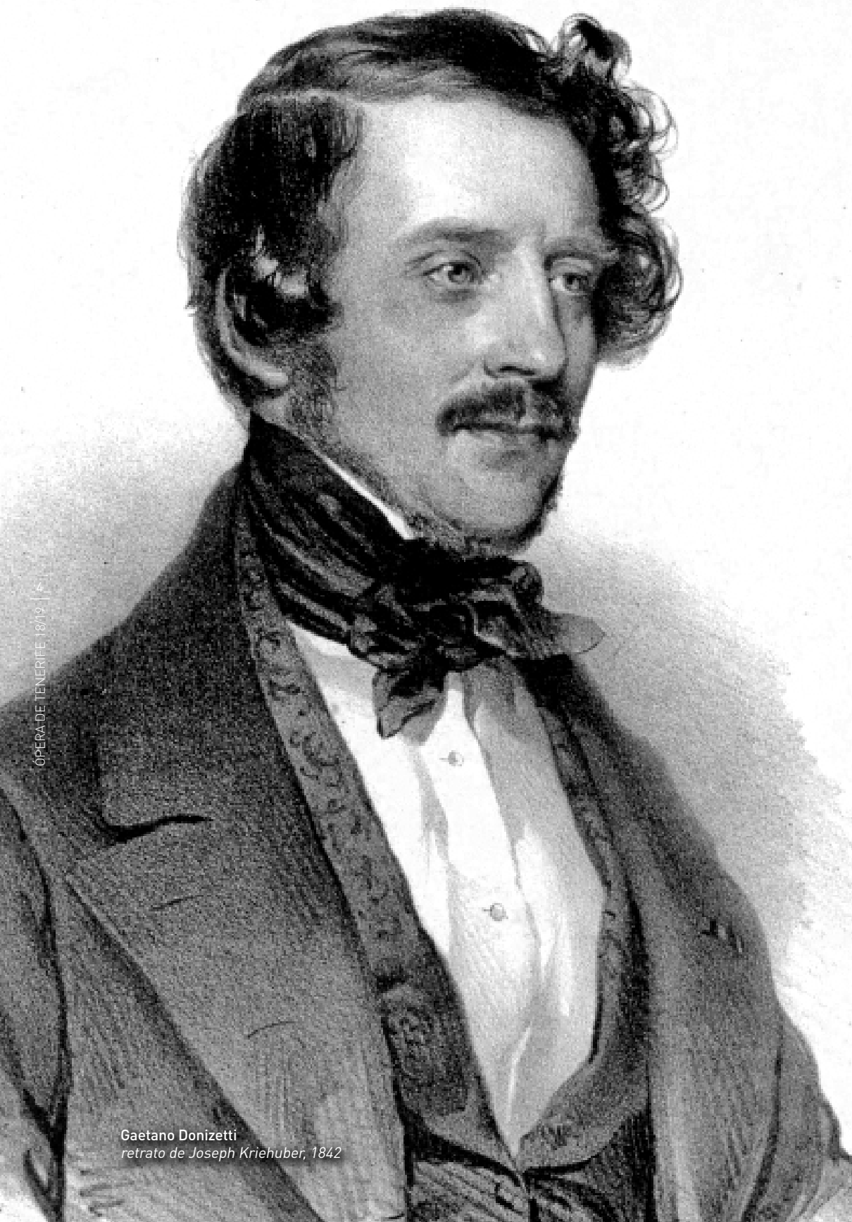
Gaetano Donizetti retrato de Joseph Kriehuber, 1842