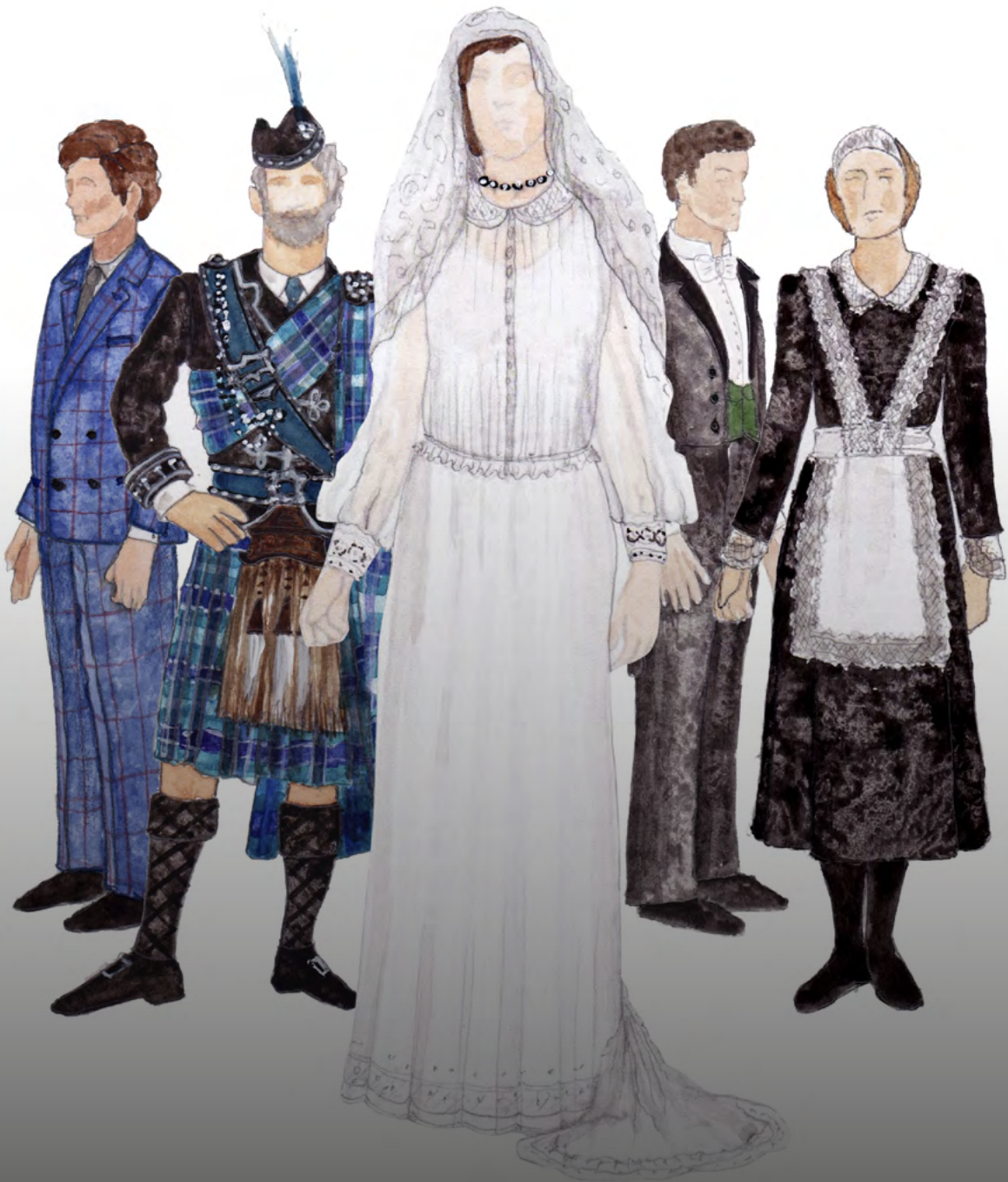
Bocetos Vestuario Lucia di Lammermoor