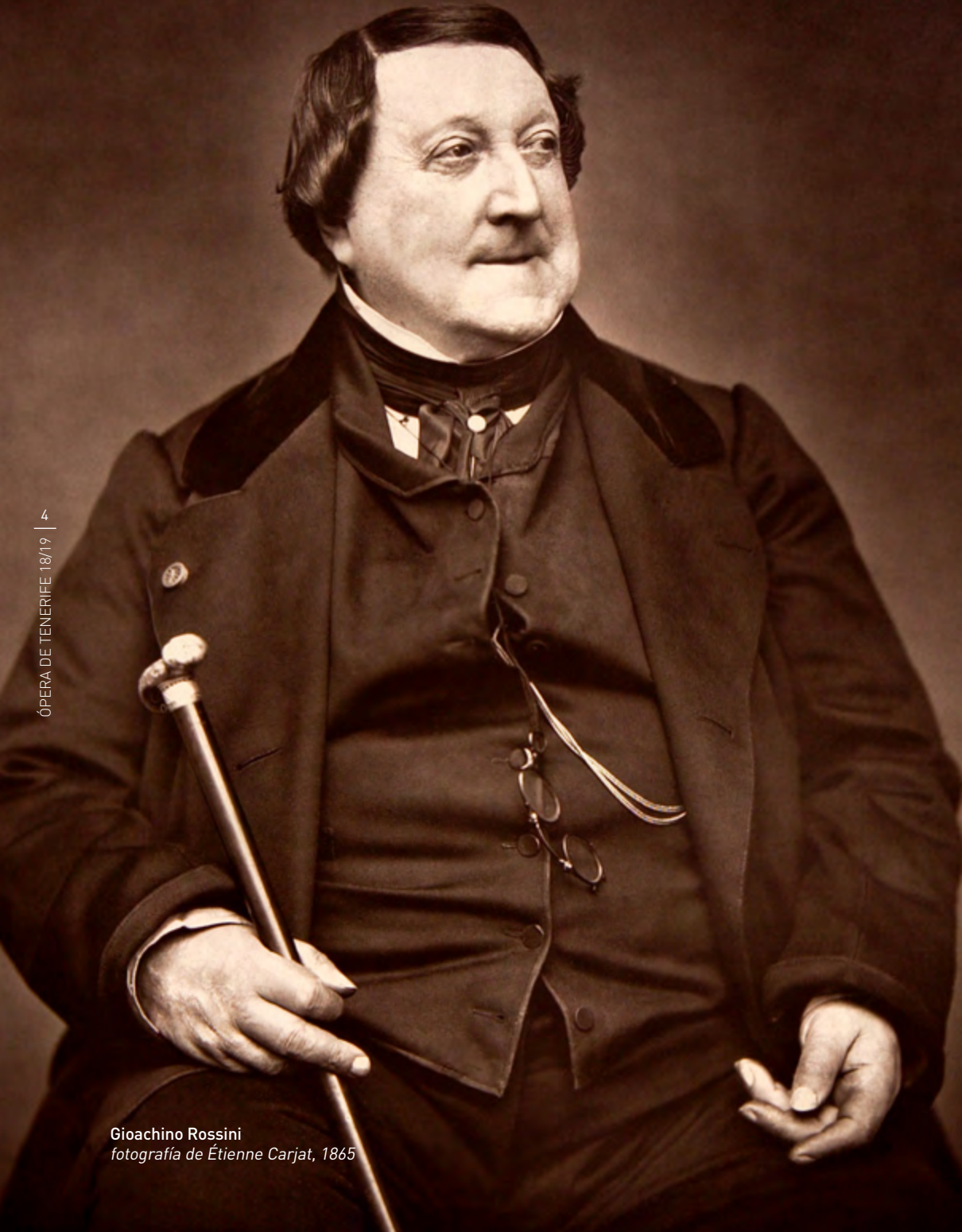
Gioachino Rossini fotografía de Étienne Carjat, 1865